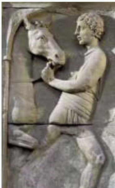
Römischer Sklave mit Pferd. Relief vom sog. Zirkusdenkmal in Neumagen an der Mosel. 2./3. Jh. n. Chr. Trier, Rheinisches Landesmuseum.