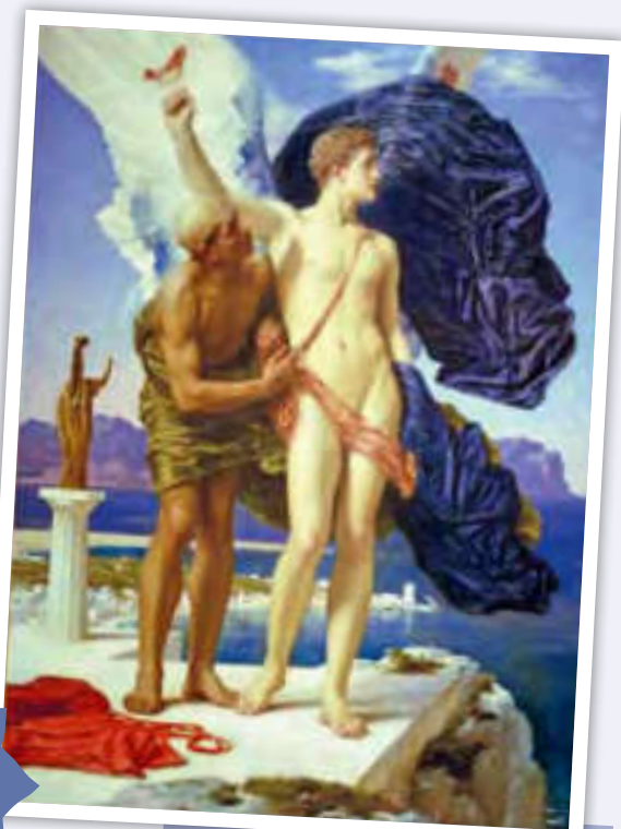
Gemälde von Frederic Lord Leighton, 1869.

Schau dir das Bild genau an. Welche Situation der Geschichte ist dargestellt?